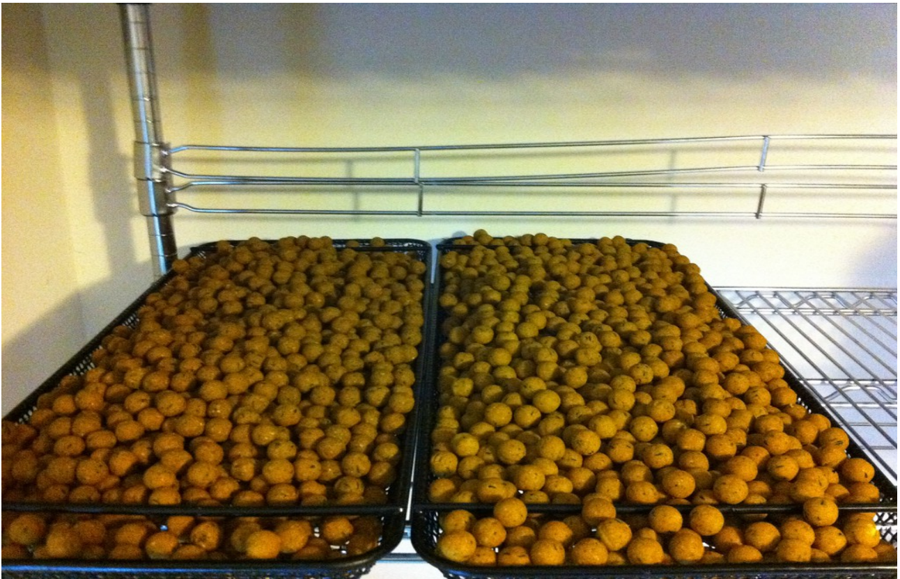
Fabriquer une grande quantité de bouillettes peut prendre du temps