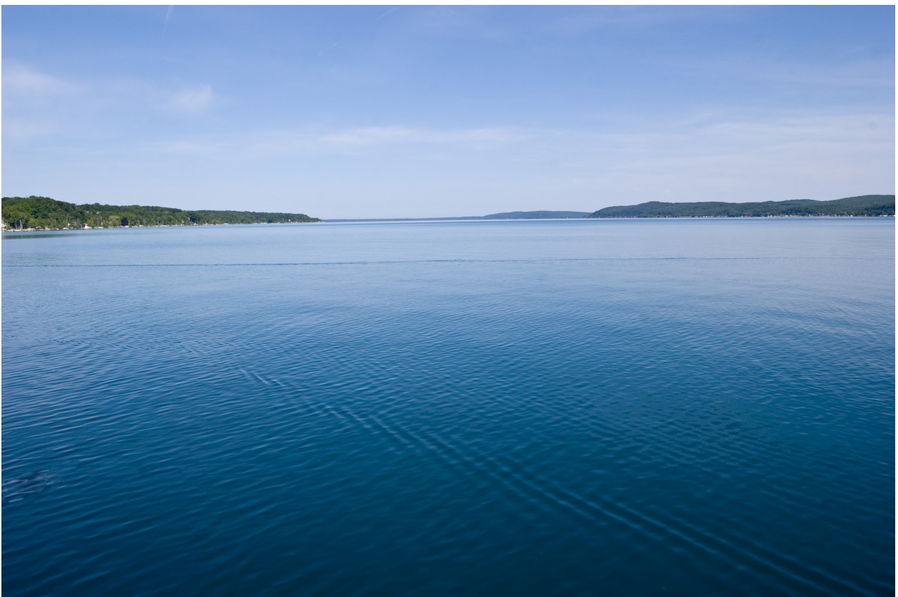
Il peut parfois être très difficile de repérer des carpes dans de grandes étendues d'eau

Si vous connaissez bien l'endroit, vous connaîtrez donc les zones où potentiellement les carpes peuvent se tenir ( les souches, les herbiers, les hauts-fonds etc...). Ce qui vous facilitera la tâche pour déceler les signes de leur présence.