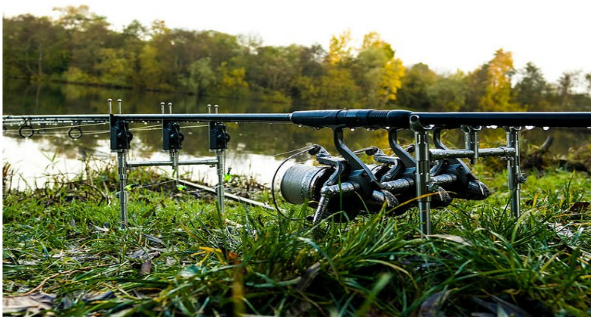
Cette batterie fait partie de ce que j'ai appelé « les indispensables »

Voici ci-contre un tableau. Sur la colonne de gauche, j'ai mis les « indispensables », le matériel qu'il est difficile de ne pas prendre avec soi, et à droite les « pas indispensables », le matériel que l'on peut laisser à la maison, donc que l'on n'est pas obligé d'acheter, ou en tout cas, pas au début.